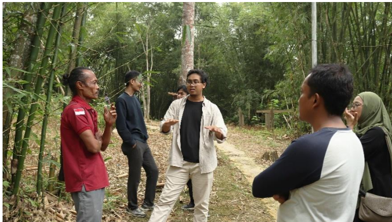
Gambar 1. Proses koordinasi bersama stakeholder

Pelaksanaan program pengabdian kepada masyarakat ini berlangsung selama delapan bulan dengan melibatkan kelompok sadar wisata (Pokdarwis) sebagai mitra utama. Pada tahap persiapan dan perencanaan, dilakukan identifikasi kebutuhan, pemetaan potensi bambu, dan penyusunan rencana teknis yang disepakati bersama mitra. Hasil tahap ini adalah terbentuknya kelompok peserta berjumlah keseluruhan 25 anggota yang siap mengikuti pelatihan serta rencana produk bambu yang relevan dengan identitas lokal Bamboe Wanadesa.