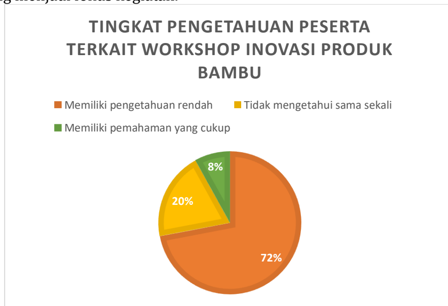
Gambar 7. Diagram tingkat pengetahuan peserta terkait workshop inovasi produk bambu

yang cukup terhadap materi tersebut. Temuan ini mengindikasikan bahwa sebelum pelatihan dilaksanakan, tingkat pemahaman masyarakat sasaran masih sangat terbatas pada ketiga aspek yang menjadi fokus kegiatan.