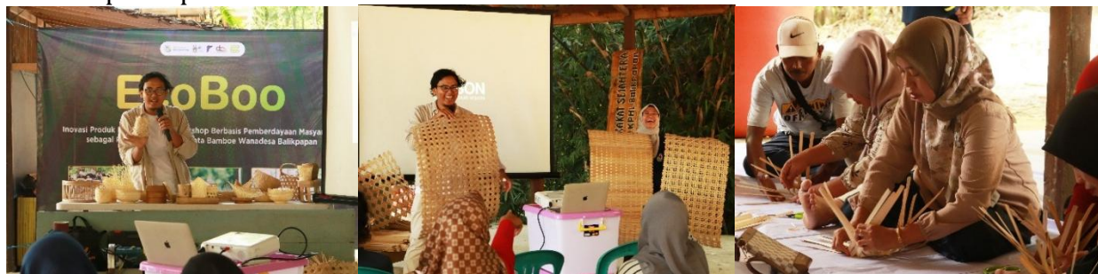
(a) Pemaparan materi

Tahap awal pelatihan berfokus pada keterampilan teknis pengolahan bambu. Peserta dilatih mulai dari pemilihan bambu berkualitas, teknik pembelahan, pengawetan, penyerutan, hingga perakitan produk sederhana. Hasil kegiatan ini berupa kemampuan peserta memproduksi beberapa jenis produk fungsional seperti tatakan gelas, vas mini, dan gantungan kunci. Produk yang dihasilkan memiliki kualitas yang cukup baik dan siap digunakan sebagai cenderamata di kawasan ekowisata. Selain itu, pelatihan ini meningkatkan rasa percaya diri peserta dalam memanfaatkan potensi bambu sebagai sumber pendapatan baru.