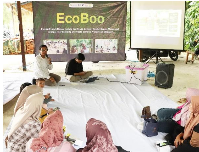
Gambar 6. Proses pelatihan manajemen usaha

Untuk mengukur peningkatan pengetahuan peserta, tim pelaksana melaksanakan pengumpulan data melalui penyebaran kuesioner kepada seluruh peserta pelatihan. Data yang diperoleh dianalisis menggunakan pendekatan statistik deskriptif untuk mendapatkan gambaran yang jelas mengenai perubahan tingkat pemahaman. Hasil analisis menunjukkan adanya peningkatan yang cukup signifikan antara hasil pre-test yang dilakukan sebelum kegiatan dan post-test setelah pelatihan berakhir. Penggunaan instrumen kuesioner memungkinkan penilaian yang objektif terhadap efektivitas program dalam meningkatkan kapasitas peserta. Ringkasan hasil evaluasi disajikan pada Tabel 1.