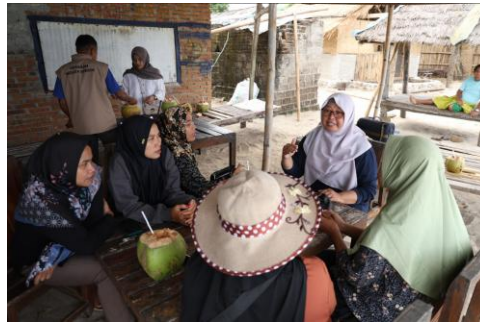
Gambar 2. Koordinasi dengan Calon Peserta Pelatihan (Ibu-Ibu kelompok Wanita tani) KWT terkait dengan Kegiatan Pengabdian Kepada Masyarakat