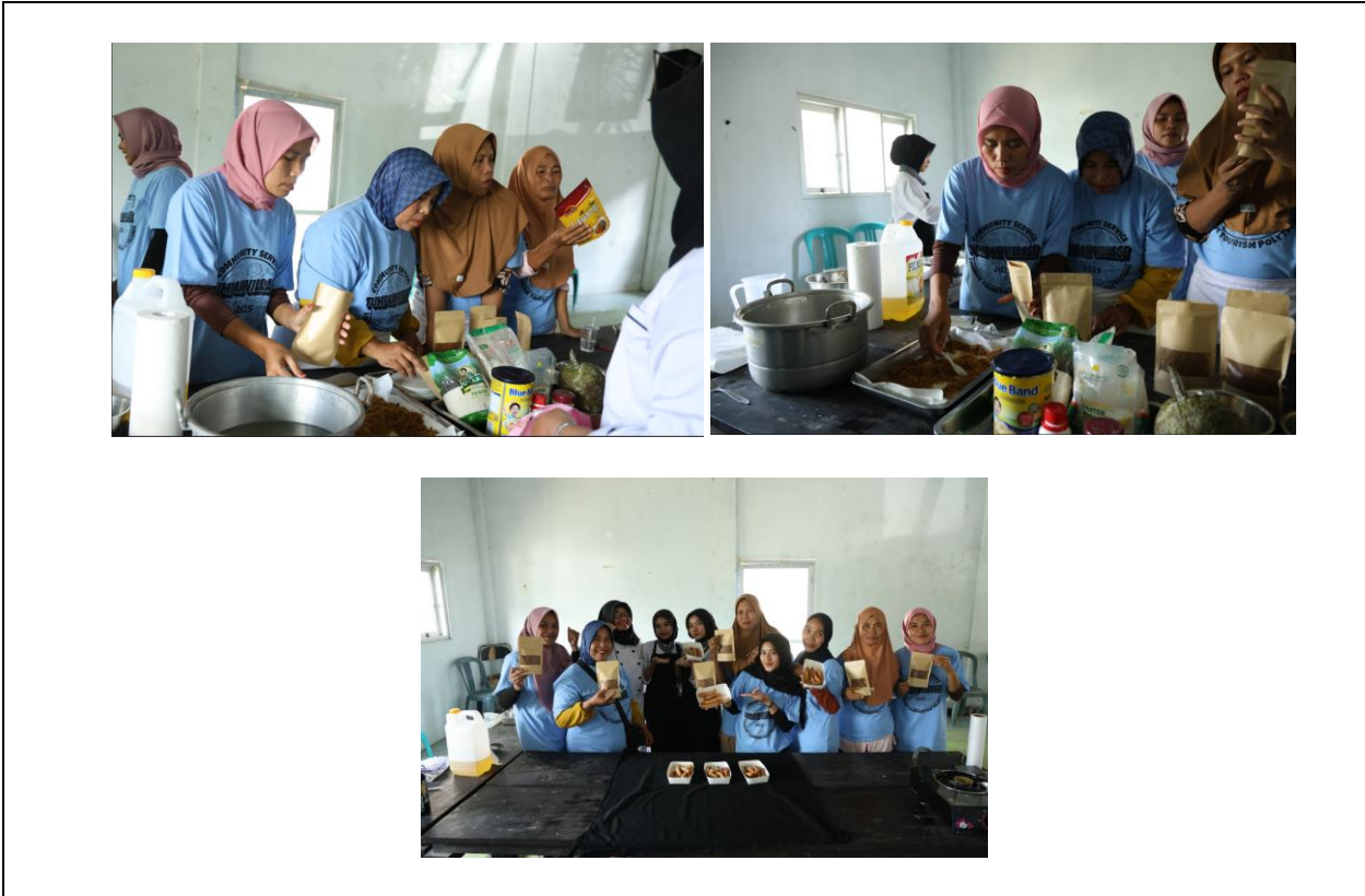
Gambar 7. Pelaksanaan Pelatihan Pengolahan Pangan Lokal Pembuatan Abon Ikan Tuna

Sepanjang pelatihan ini peserta diajarkan cara mengolah ikan tuna lokal menjadi abon ikan tuna yang dapat dijual kepada wisatawan. Proses ini meliputi pemilihan bahan ikan yang tepat, teknik memasak ikan tuna, pengolahan bumbu, dan cara pengemasan yang menarik, peserta juga diajarkan cara mengolah sukun, salah satu bahan lokal, menjadi churros sukun yang bisa dijadikan camilan khas desa. Peserta diajarkan mulai dari pemilihan sukun yang tepat, pembuatan adonan, hingga cara menggoreng dan menyajikan churros sukun.