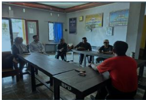
Gambar 1. Observasi dengan kepala Desa wisata Tumpak Kabupaten Lombok Tengah

Salah satu tantangan utama adalah keterbatasan pengetahuan dan keterampilan mitra terhadap pengolahan pangan lokal. Termasuk aspek pengetahuan dan keterampilan dalam pengolahan. Diskusi dengan ketua Bapak kepala Desa menunjukkan kebutuhan pendampingan intensif dalam mengidentifikasi potensi pangan lokal serta memanfaatkannya untuk kemajuan ekonomi Masyarakat serta pengembangan pariwisata setempat.