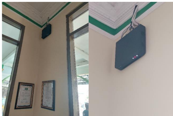
Gambar 7 DVR

Dengan Perancangan dan Pemasngan CCTV ini, Masjid An-Nur Sawojajar 2 kini memiliki fasilitas yang mendukung keamanan kegiatan keagamaan yang lebih baik. Salah satu solusi efektif untuk meningkatkan keamanan adalah dengan memasang kamera pengawas atau CCTV.