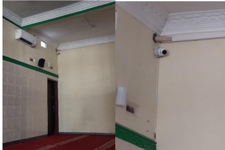
Gambar 5 CCTV Titik Ketiga