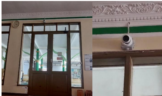
Gambar 6 CCTV Titik Keempat

Pemasangan CCTV pada titik Keempat dipasang pada bagian tengah belakang masjid menghadap kebagian belakang imam, mimbar kutbah, dan shof sholat. Tujuan pemasangan ini adalah untuk memberikan pengawasan terhadap seluruh jamaah agar tetap kondusif saat melaksanakan sholat berjamaah, pengawasan terhadap barang-barang jamaah yang mungkin diletakkan ditepi shof, juga untuk melakukan perekaman saat dilaksanakannya Perayaan Hari Besar atau saat ada ceramah mubaligh di masjid ini. Gambar 6.