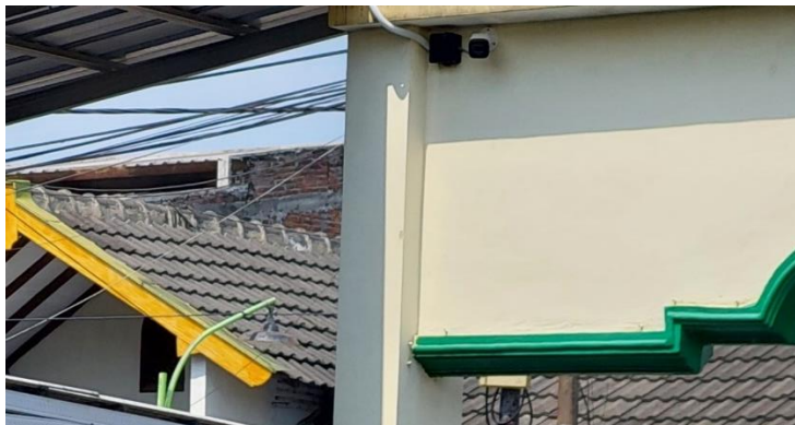
Gambar 3 CCTV Titik Pertama