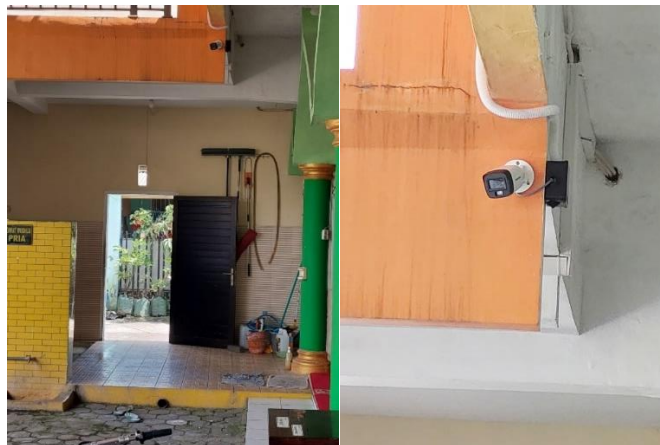
Gambar 4 CCTV Titik Kedua

Pemasangan CCTV pada Titik Kedua dipasang pada bagian dinding tempat wudhu pria, dimana CCTV ini mengarah pada area parkir dan serambi selatan masjid. Berfungsi sebagai pengamanan untuk kendaraan para jamaah yang diparkir di area parkir masjid dan sebagai fungsi pengawasan kotak amal yang berada di serambi masjid Gambar 4 .