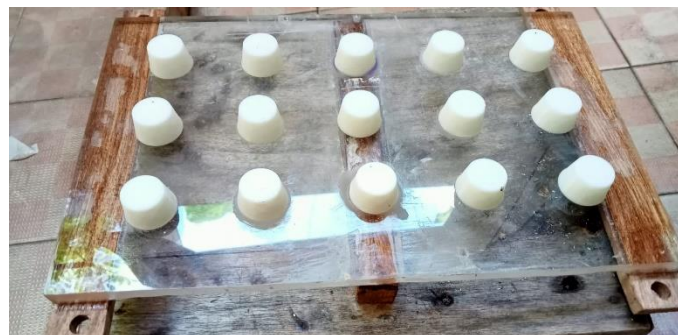
Gambar 6. Papan Penekan

Papan penekan yang memiliki bahan baku utama menggunakan material Akrilic. Penggunaan papan penekan pada perancangan alat yaitu menekan adonan kedalam cetakan saat proses pengepresan supaya adonan dapat merata kedalam cetakan. Penggunaan material akrilick yang felxibel dan tidak mudah pecah serta mudah dalam perawatan. Sedangkan kekurangan harga lebih tinggi dan pada proses pengolahanya memperlakuan khusus.