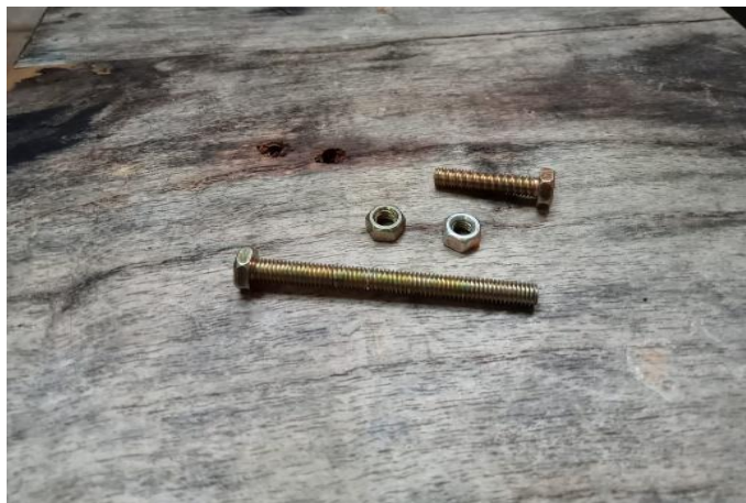
Gambar 8. Baut Pengunci

Penggunaan baut pengunci pada alat sebagai tumpua poros tuas penekan dan juga pegas. Material yang memiliki bahan baja ini dipilih karena mempunyai struktur yang kuat serta mudah dalam perawatanya. Keuntungan menggunakan baut pengunci adalah cukup mudah dalam proses assembly. Sedangkan kekurangan perlu diberikan perawtan khusus sehingga tidak ada timbunya karat dan ulir yang macet.