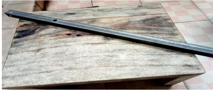
Gambar 4. Tuas Penekan

Tuas penekan yang terletak diantara kedua rangka bagian depan. Penggunaan tuas ini memberikan kemudahan bagi pengguna pada proses penekanan adonan. Tekanan pada tuas akan mendorong adonan kedalam cetakan secara merata. Cara kerja mekanisme yang sederhana dapat mempermudah pengguna dalam pengoprasian alat.