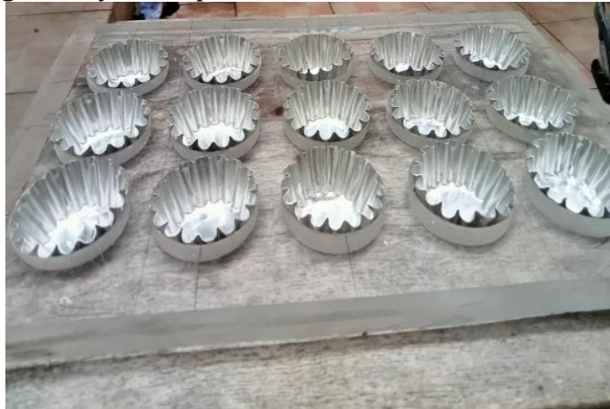
Gambar 7. Dudukan Cetakan

Dudukan cetakan yang memiliki bahan baku utama menggunakan material Akrilic. Penggunaan dudukan cetakan pada perancangan alat yaitu sebagai dudukan cetakan saat proses pengepresan adonan supaya tidak bergeser. Keuntungan material akrilick adalah tidak mudah pecah serta mudah dalam perawatan. Sedangkan kekurangan harga lebih tinggi dan pada proses pengolahanya memperlakuan khusus.