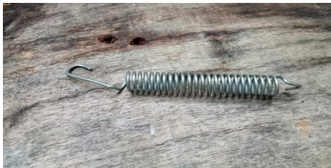
Gambar 5. Pegas

Pegas merupakan elemen elastis dimana pegas tersebut dapat terdeformasi pada waktu pembebebanan dengan menyimpan energi, bila beban dilepaskan pegas akan kembali seperti sebelum terbebani. Penggunaan pegas pada alat yaitu untuk mengembalikan posisi tuas pada posisi semula pada mekanisme proses pengepresan adonan.