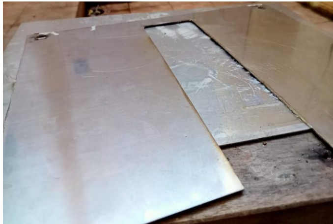
Gambar 9. Lempeng Plat