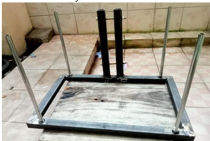
Gambar 3. Rangka

Rangka biasa banyak digunakan di setiap alat di Indonesia. Biasa memiliki spesifikasi yang berbeda-beda sesuai kebutuhannya. Desain rangka yang sederhana pada alat dan pemilihan bahan yang ringan bertujuan mengurangi berat alat, menjadikan alat terkesan simple dan mudah digunakan di segala kondisi. Kekurangan rangka ini adalah walaupun dibuat dengan besi yang kuat dan di segala kondisi tetapi harus perlu perawatan rutin supaya tetap terjaga kebersihan dan kualitasnya.