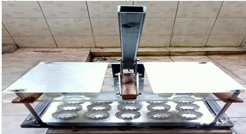
Gambar 10. Alat Cetak Nastar Keranjang

Alat cetak nastar adalah sebuah alat yang dirancang k untuk memenuhi kebutuhan nastar keranjang pada UMKM Selera Purbalingga.