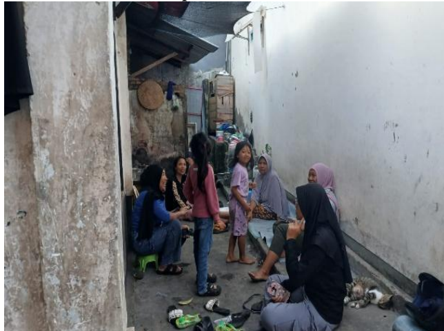
Gambar 4. Gang menjadi ruang keluarga perpanjangan dari ruang rumah.

Dalam konteks ini, praktik keseharian seperti memasak, makan bersama, duduk dan bercengkrama tidak hanya di dalam rumah, tetapi meluas ke area gang yang dapat dilihat pada gambar 4. Aktivitas domestik mengalir keluar tanpa batas yang tegas, menjadikan gang sebagai perpanjangan ruang dalam ( extended domestic space ) rumah. Keterbatasan ruang di dalam hunian, ditambah dengan kuatnya relasi kekerabatan, mendorong gang untuk berfungsi sebagai ruang domestik tambahan yang digunakan secara intens dan berkelanjutan. Dengan demikian, ruang gang tidak hanya dihidupi, tetapi juga “dimiliki secara makna” oleh kelompok keluarga, sehingga membentuk karakter ruang yang lebih privat, stabil, dan konsisten dalam kehidupan sehari-hari.