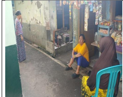
Gambar 2. Warung menjadi salah satu titik pusat interaksi sosial warga gang RT 3 Lingkungan Dende Seleh

Selain itu, area yang memungkinkan aktivitas menetap, seperti duduk, bersantai, bercengkrama, dan berkumpul tanpa sepenuhnya mengganggu sirkulasi, cenderung menjadi lokus utama interaksi sosial. Temuan ini sejalan dengan studi kampung kota yang menunjukkan bahwa ruang gang tidak hanya berfungsi sebagai jalur sirkulasi, tetapi juga sebagai ruang sosial yang mengakomodasi beragam aktivitas keseharian masyarakat [5], [9], [10],[11].