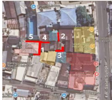
Gambar 2. Peta lokasi gang 1,2,3,4,5 di RT 3 Lingkungan Dende Seleh Kota Tua Ampenan

Ketika memasuki sore hingga malam hari (15.00-20.00 WITA), terjadi peningkatan signifikan aktivitas sosial. Aktivitas sosial nampak mulai meningkat ketika warga, terutama ibu-ibu, keluar rumah untuk berinteraksi. Meja dan kursi mulai dikeluarkan ke area gang, warung kembali beroperasi, dan anak-anak mulai bermain di ruang yang sama. Berdasarkan hasil place-centered mapping (PCM), titik-titik di sekitar warung dan area berdagang menjadi pusat konsentrasi interaksi sosial, seperti duduk santai, bercengkrama, mengawasi anak-anak yang sedang bermain, dan lain-lain .