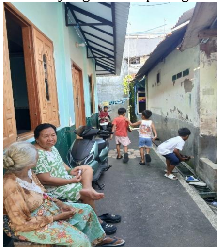
Gambar 3. Kondisi gang 1 dimana ibu-ibu duduk ngobrol sambil mengawasi anak-anak bermain di gang.

Pada periode ini, praktik keseharian mulai terakumulasi seperti kursi dikeluarkan ke depan rumah, anak-anak bermain di gang, dan percakapan antarwarga berlangsung di sepanjang koridor sempit. Tubuh-tubuh yang sebelumnya tersebar mulai berkumpul dan membentuk konsentrasi aktivitas dalam ruang yang terbatas. Produksi ruang yang terjadi melalui repitisi praktik seperti duduk bersama, bermain, berinteraksi yang berlangsung secara berulang pada waktu tertentu yang terlihat pada gambar 3.