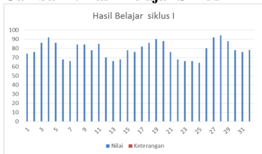
Gambar 2. Hasil Belajar Siklus I