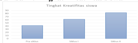
Gambar 4. Tingkat Kreatifitas siswa

Berdasarkan tabel dan diagram diatas menunjukkan bahwa dengan adanya Penerapan model pembelajaran Project Based Learning pada pelajaran IPS materi Interaksi Antar Ruang Kelas VII C Mts Negeri 4 Tegal telah dilaksanakan dengan baik. Terlihat dari tingkat kreatifitas peserta didik saat menyelesaikan tugas yang diberikan oleh guru meningkat dari pengamatan pada prsiklus sebesar 42,5% dan pada siklus I meningkat menjadi 62,5%. Dan siklus II meningkat