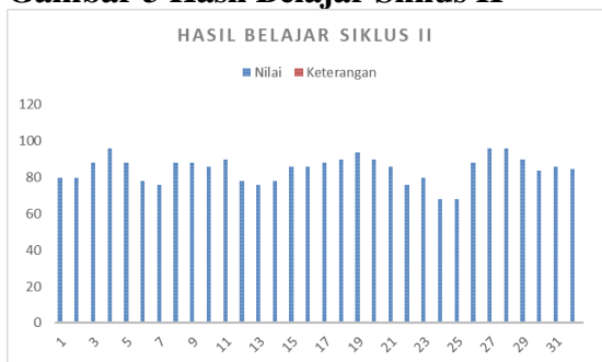
Gambar 3 Hasil Belajar Siklus II

Berdasarkan Tabel dan Diagram 4.3 menunjukkan bahwa sebanyak 1 orang peserta didik tidak tuntas dari 24 orang peserta didik dikelas. Atau sebanyak 4,17% peserta didik tidak tuntas dan sebanyak 23 orang peserta didik tuntas atau 95,83% dengan ketuntasan atau KKM IPS yaitu 70. Penerapan model pembelajaran Project Based Learning pada siklus II peserta didik telah bisa menyesuaikan dengan baik. Dan mengikuti langkah langkah pembelajaran yang telah di arahkan oleh guru. Pembelajaran interaksi antar ruang dilingkungan sekitar peserta didik dengan membuat proyek yang disesuaikan dengan kemampuan peserta didik. Sehingga peserta didik menjadi terbiasa. Hasil belajar dan indikator ketuntasan telah mencapai pada tahap indikator pencapaian yang diinginkan yaitu sebesar 85%. Bahkan dari hasil perlakuan pada siklus II menghasilkan capaian yang lebih yaitu sebesar 95,83% KKM klasikal pada kelas VII C MTs Negeri 4 Tegal. Adanya kajian dan evaluasi dari kekurangan dan kelemahan pada siklus I telah dikaji dan ditingkatkan pada perlakuan siklus II sehingga hasilnya bisa sesuai dengan indikator pencapaian. Guru dan peserta didik berkolaborasi baik dalam pembelajaran, sehingga penggunaan medel pembelajaran berbasis proyek telah berhasil meningkatkan hasil pembelajaran peserta didik pada materi pengembangan pada kelas VII C MTs Negeri 4 Tegal dapat meningkat secara signifikan.