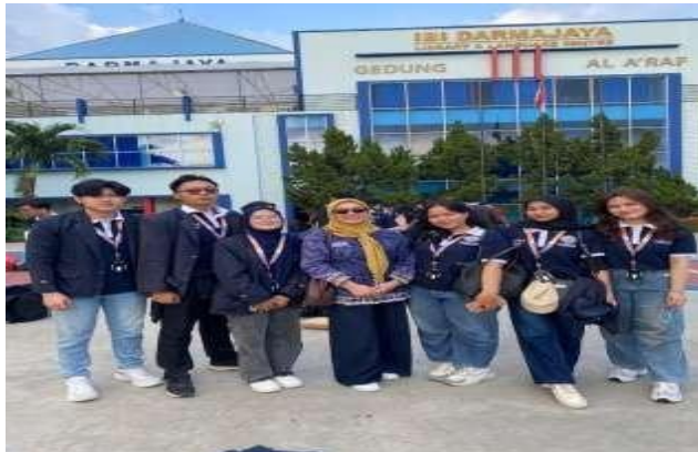
Gambar 10. Tim Pengabdian Masyarakat