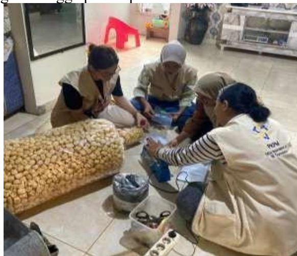
Gambar 7. Pengemasan Produk Proses Tahu Bagus Hasby Posyandu Bayi dan Balita sekaligus pembagian PMT-A pudding ubi jalar

Mahasiswa turun langsung ikut serta dalam proses packing produk mulai dari menimbang berat per bungkus hingga proses press kemasan.