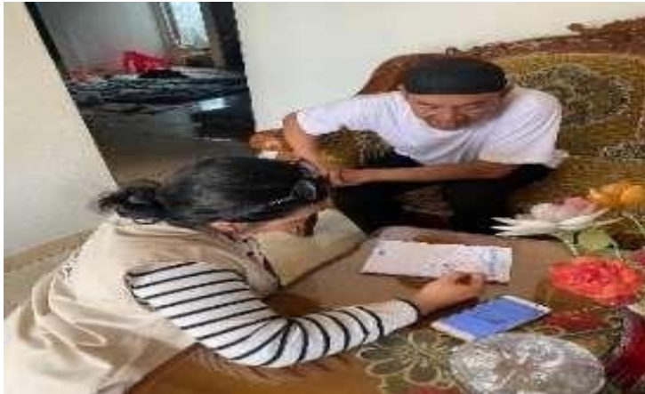
Gambar 5. Pelatihan Pembukuan Manual

konsisten. Pemilik mengaku sudah tidak melakukan pencatatan keuangan secara manual sejak 3 tahun terakhir, jadi disini saya berinisiatif untuk melakukan pelatihan pencatatan keuangan sederhana agar mengingatkan kembali pemilik usaha bagaimana cara pencatatan keuangan yang baik dan memotivasi pemilik usaha untuk melakukan pencatatan secara konsisten guna meningkatkan kinerja keuangan dalam usaha yang dilakukan oleh pemilik UMKM Kerupuk Tahu Bagus Hasby.