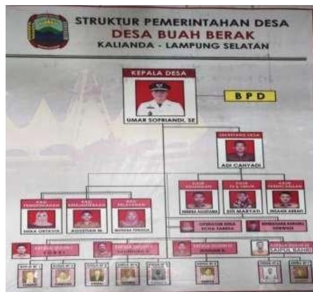
Gambar 1. Struktur Pemerintahan Desa Buah Berak