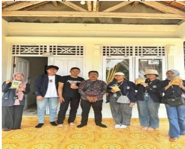
Gambar 3. Kunjungan UMKM Kerupuk Tahu Bagus Hasby

Sebelum melakukan program kerja PKPM di Kerupuk Tahu Bagus Hasby, kami melakukan kunjungan terlebih dahulu kepada pemilik UMKM Kerupuk Tahu Bagus Hasby. Serta mengumpulkan data tentang keuangan, pemasarannya, logo, dan kemasan dari UMKM Kerupuk Tahu Bagus Hasby untuk program kerja PKPM.