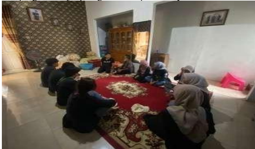
Gambar 4. Izin dengan UMKM Kerupuk Tahu Bagus Hasby

Kami juga meminta izin kepada Bapak Tubagus Habibi selaku pemilik UMKM kerupuk Tahu Bagus Hasby agar diberi izin serta bimbingan di UMKM miliknya selama menjalankan program kerja pengabdian kepada masyarakat.