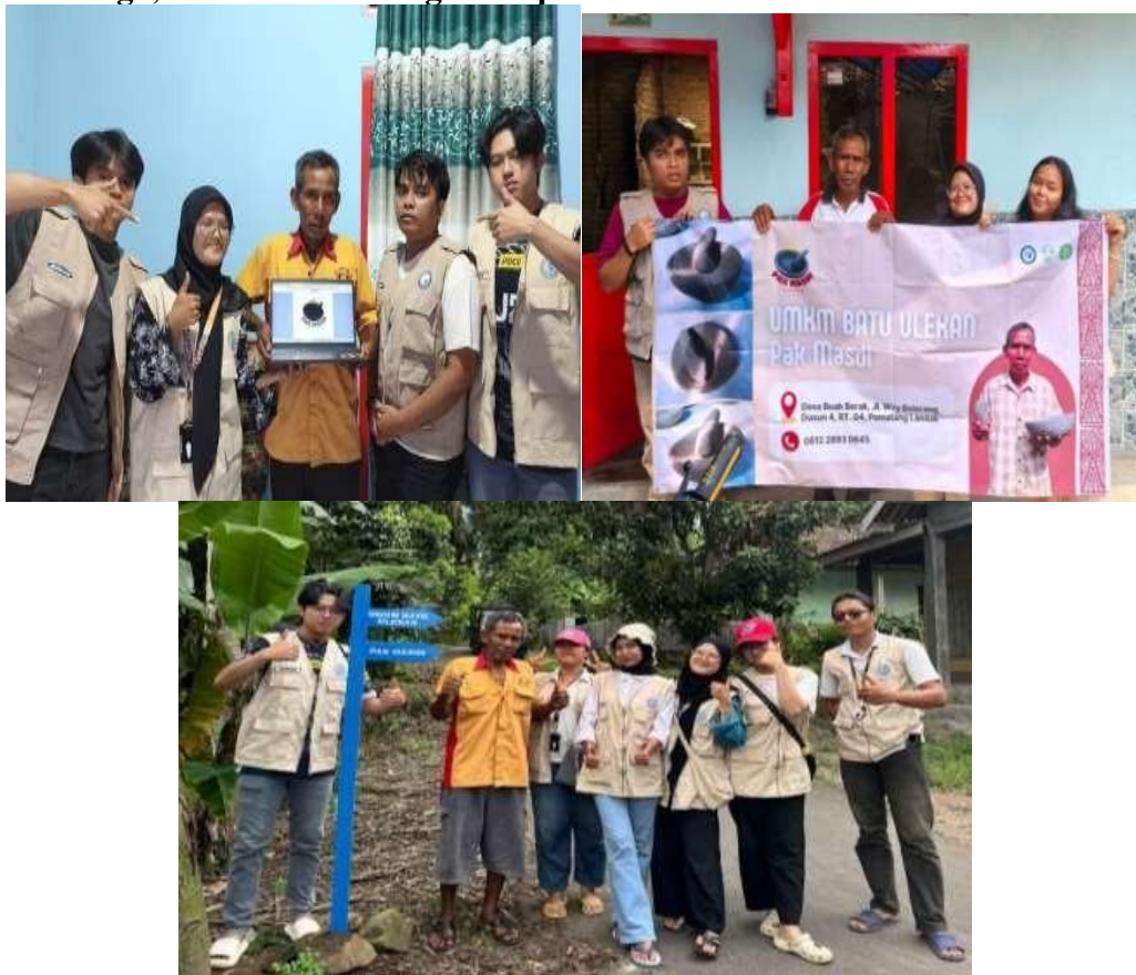
Gambar 9. Penyerahan Logo, Banner, dan Plang Arah UMKM Batu Ulekan. Waktu Kegiatan: Bulan Agustus 2025.