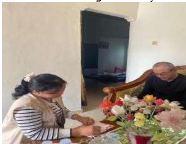
Gambar 11. Pelatihan dan Penyerahan buku kas kepada UMKM