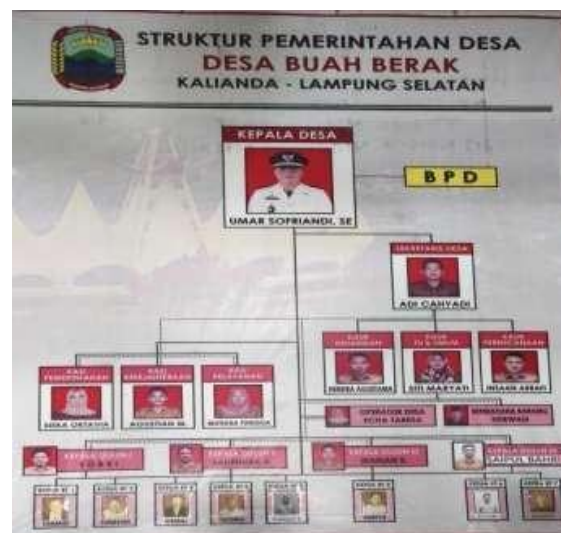
Gambar 1. Struktur Pemerintahan Desa Buah Berak