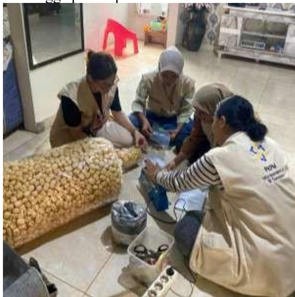
Gambar 6 Pengemasan Produk Proses Tahu Bagus Hasby

Mahasiswa turun langsung ikut serta dalam proses packing produk mulai dari menimbang berat per bungkus hingga proses press kemasan.