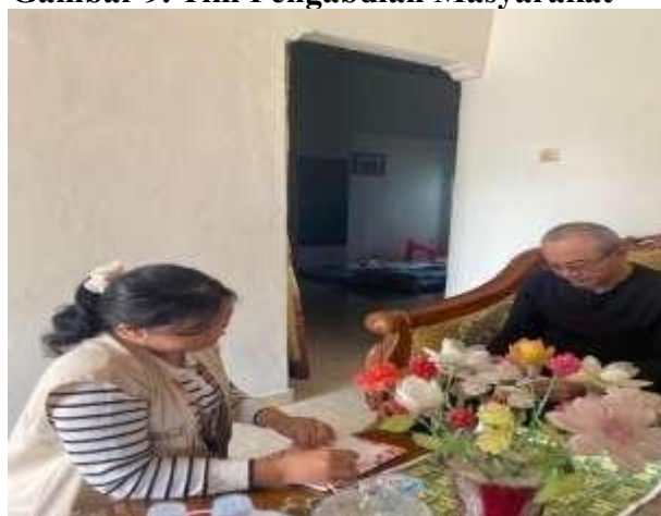
Gambar 10. Pelatihan dan Penyerahan buku kas kepada UMKM