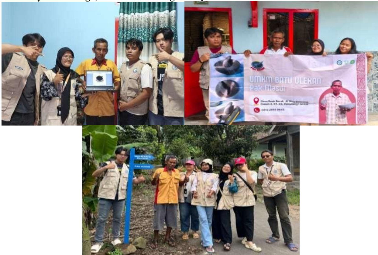
Gambar 8. Penyerahan Logo, Banner, dan Plang Arah UMKM Batu Ulekan.