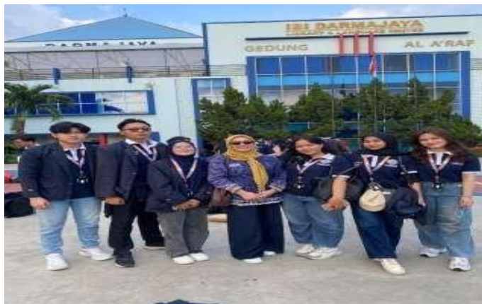
Gambar 9. Tim Pengabdian Masyarakat