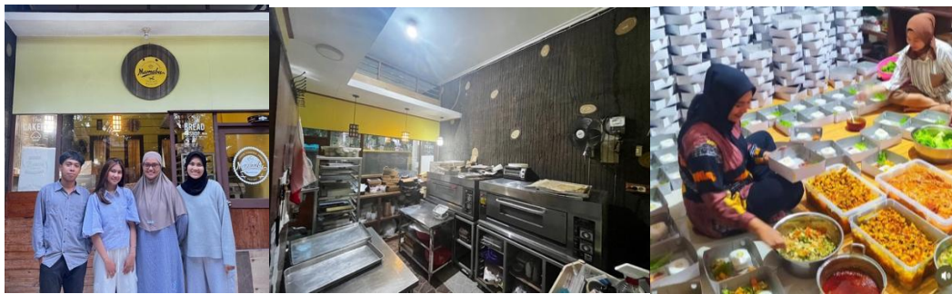
Gambar 1. Foto dengan owner (Sesi Observasi dan Pemahaman)

Pada saat pengaplikasian pencatatan transaksi, pemilik berkonsultasi mengenai cara memisahkan uang pengeluaran rumah tangga pribadi dengan kas operasional produksi agar modal usaha tidak terpakai. Selain itu, pemilik menanyakan cara menentukan margin keuntungan ( markup ) yang ideal dari nilai HPP riil tanpa menetapkan harga yang terlalu tinggi di pasar lokal. Terkait dengan strategi penetapan harga ( pricing strategy ), pemilik juga menanyakan hubungan penentuan harga tersebut dengan target profitabilitas laba bersih bulanan yang ingin dicapai usaha. Gambar 1 di bawah ini menggambarkan foto kegiatan pada saat pelaksanaan pendampingan.