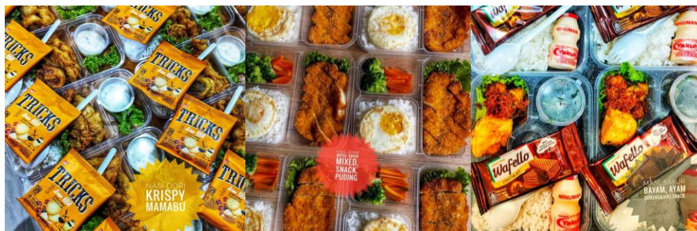
Gambar 7. Foto 3 Menu Catering (Rabu, Kamis, Jumat)