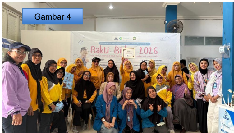
Gambar 4. Dokumentasi foto bersama antara tim pengabdian, pimpinan klinik, tenaga kesehatan dan peserta, setelah pelaksanaan kegiatan sebagai bentuk apresiasi, kebersamaan dan komitmen dalam mendukung upaya pencegahan stunting.