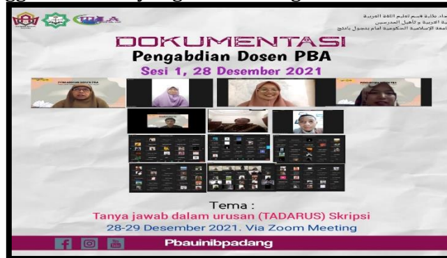
Gambar 3: Dokumentasi Pengabdian Dosen PBA, sesi 1, Selasa 28 Desember 2021

Kegiatan webinar pengabdian dosen ini berlangsung dengan penuh semangat. Sehingga kegiatan ini berlangsung lebih lama dari durasi waktu yang telah dagendakan. Demikian banyaknya peserta yang bertanya dan merespon materi yang disampaikan oleh masing-masing nara sumber membuat hampir semua peserta yang terlibat dalam kegiatan itu terlibat aktif, sehingga merasa sayang untuk menghentikan diskusi yang sedang berjalan.