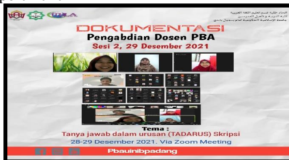
Gambar 4: Dokumentasi Pengabdian Dosen PBA, sesi 2, Rabu 29 Desember 2021 Tahap Evaluasi

Respon mahasiswa juga sangat positif pada hari kedua ini, terbukti dari banyaknya jumlah peserta yang bertanya maupun sharing terkait masalah mereka dalam penulisan karya ilmiah yang sedang dikerjakan. Kegiatan ini seperti ruang diskusi yang nyaman bagi setiap peserta yang berperan aktif.