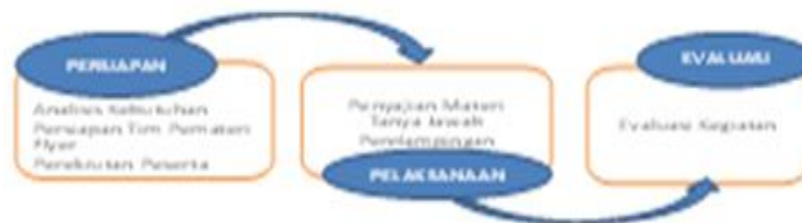
Gambar 1. Tahap Pelaksanaan Webinar Pendampingan Penulisan Karya Ilmiah

Tahap pelaksanaan, diisi dengan kegiatan penyampaian materi oleh nara sumber, tanya jawab dan pendampingan bagi mahasiswa. Tahap akhir, evaluasi kegiatan yang dilakukan dengan memnta mahasiswamengisi lembar cek ( google form ), menganalisis respon mahasiswa terhadap kegiatan ini, keaktifan mahasiswa saat dilakukan tanya jawab dan antusiasme mahasiswa untuk lanjut pada tahap pendampingan.