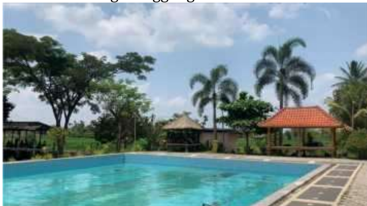
Gambar 3. Kolam Renang Manggong

Kuliner yang dimiliki Desa Batu Kumbang beraneka ragam olahan ikan air tawar, mulai dari abon lele, pilus lele, kerupuk lele, dan banyak lagi olahan bahan ikan air tawar dapat dijadikan atraksi wisata. Ke khasan tersendiri dapat menjadi branding tersendiri untuk Desa Batu Kumbang. Desa Batu Kumbang juga memiliki kue/jajanan basah yang tidak ditemukan di tempat lain seperti kelepon, sate bulayak karang mas dan lain-lain. Dari kerajinan Desa Batu Kumbang memiliki kain sesek stagen, topi/songkok The legend, anyaman ketak, dan kerajinan membuat pisau dan parang ( membuat kerajinan kerotok sapi ). Dan satu lagi wisata buatan yang dimiliki oleh Desa Batu Kumbang adalah kampung tirta, kampung tirta ini terletak di Dusun Manggong dengan mata air yang melimpah dibuatlah atraksi wisata buatan yakni kolam renang Manggong.