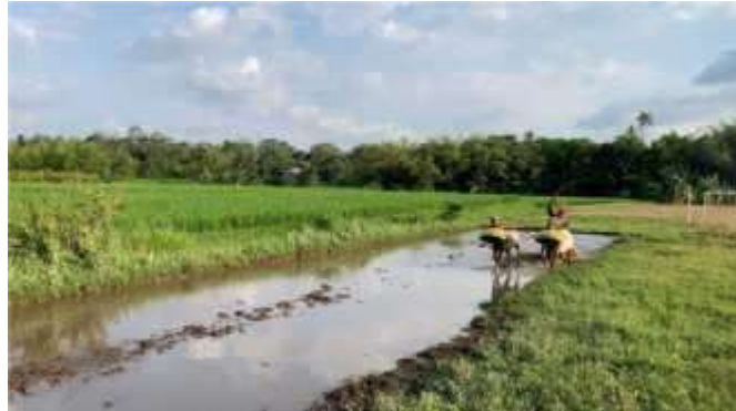
Gambar 1. Alam Dusun Side Karye