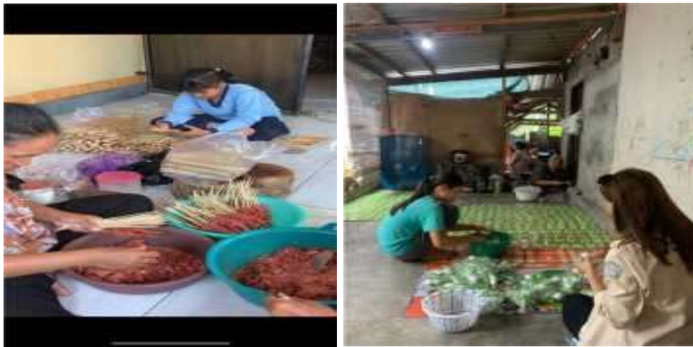
Gambar 4. Pembuatan Sate Bulayak dan Jajanan Basah