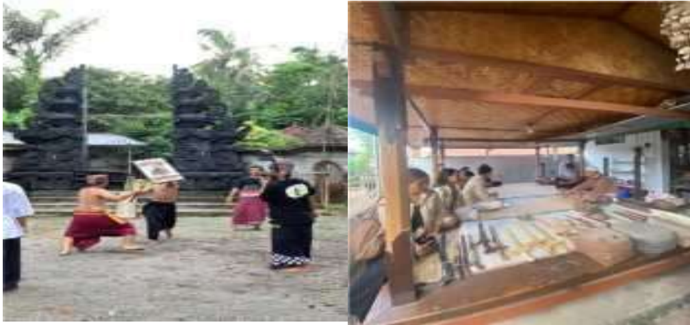
Gambar 2 Presean dan Pusaka Desa